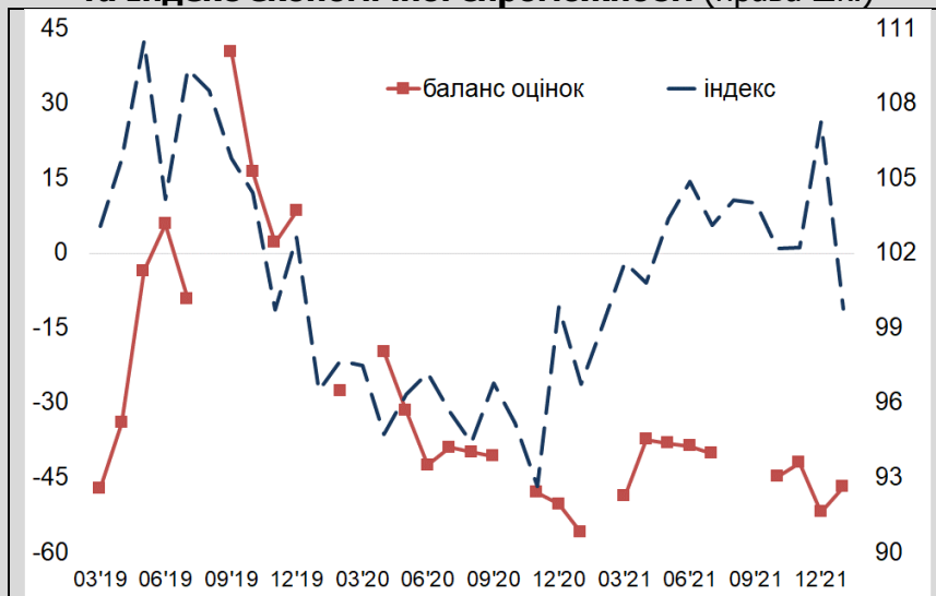
Правильність руху країни (баланс оцінок-відповідей, ліва шк.) та Індекс економічної спроможності (права шк.)

Звичайно, значну (а в окремі періоди навіть визначальну) роль у психологічному сприйнятті «правильності» розвитку ситуації в країні відіграють поточний економічний стан і економічна стійкість домогосподарств. Тому й динаміка самопочуття цілком може співвідноситись з динамікою економічних індикаторів. Так, упродовж всього 2020р. в умовах значного погіршення добробуту, у т.ч. внаслідок провальної антикоронавірусної політики, відбувалось «синхронізоване» зниження показників Індексу і значень оцінок самопочуття, які наприкінці 2020р. впали на мінімальних рівнів (діаграма « Правильність руху країни та Індекс економічної спроможності »).